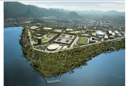
3 st Place