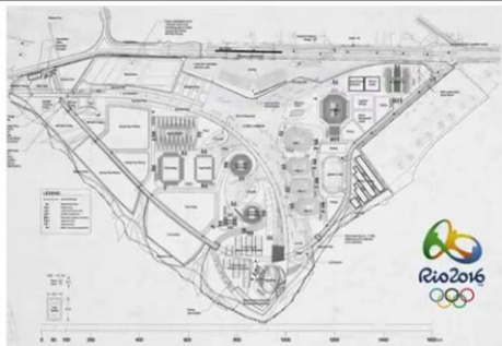
2 st Place