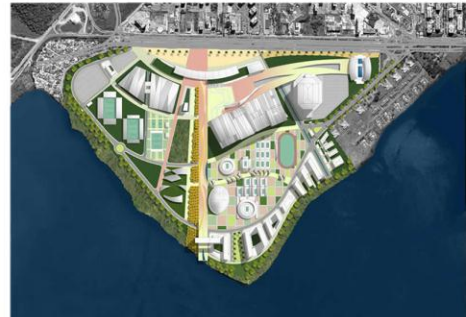
3 st Honorable Mention