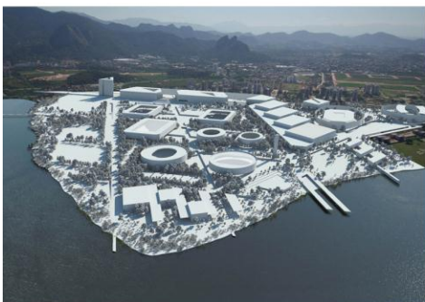
1 st Honorable Mention