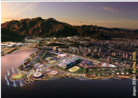
1 st Place