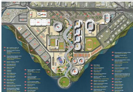
1 st Place