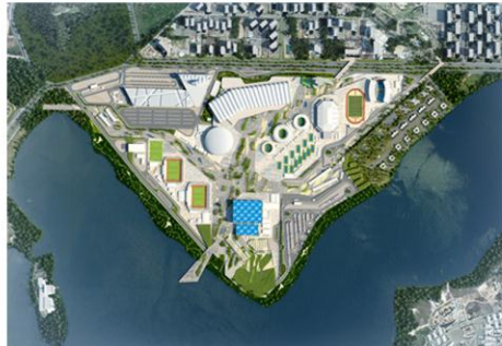
2 st Honorable Mention