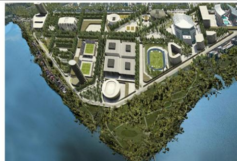
3 st Place