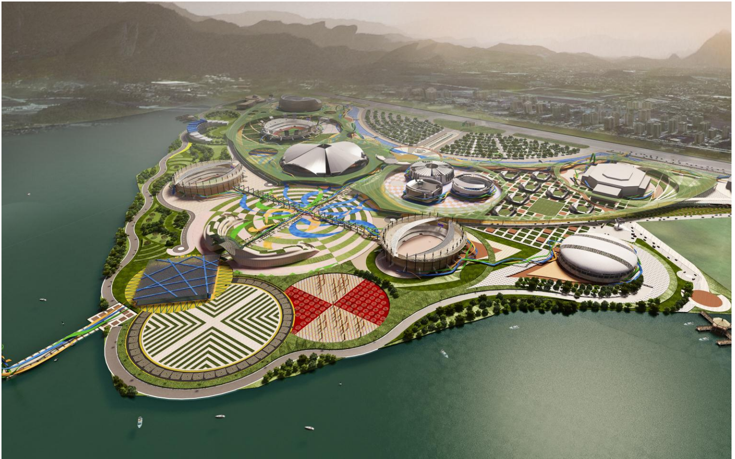
Concurso Internacional para o Plano Geral Urbanístico (Master Plan) do Parque Olímpico e Paraolímpico Rio 2016 International Competition for the Rio 2016 Olympic Park Master Plan