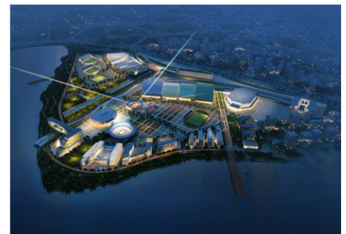
3 st Honorable Mention