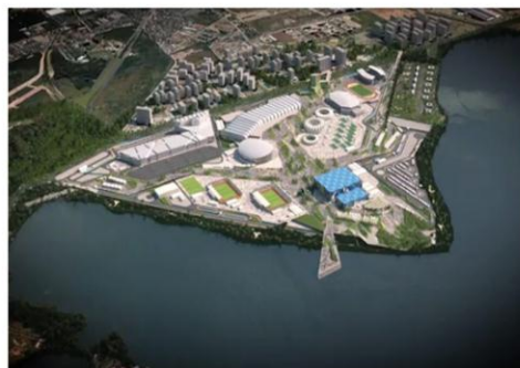
2 st Honorable Mention