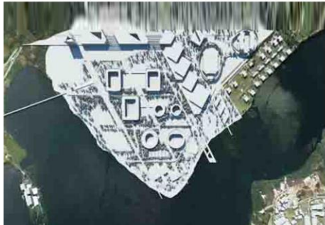
1 st Honorable Mention