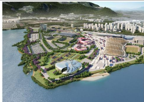
2 st Place